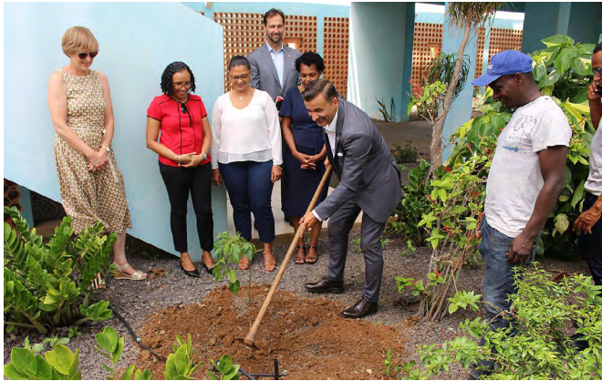
Eine EXI-Baumpflanzaktion in Cidade de Praia, Kap Verde, unter Beteiligung der AHK Portugal, der deutschen Botschafterin in Kap Verde sowie dem lokalen Projektpartner.